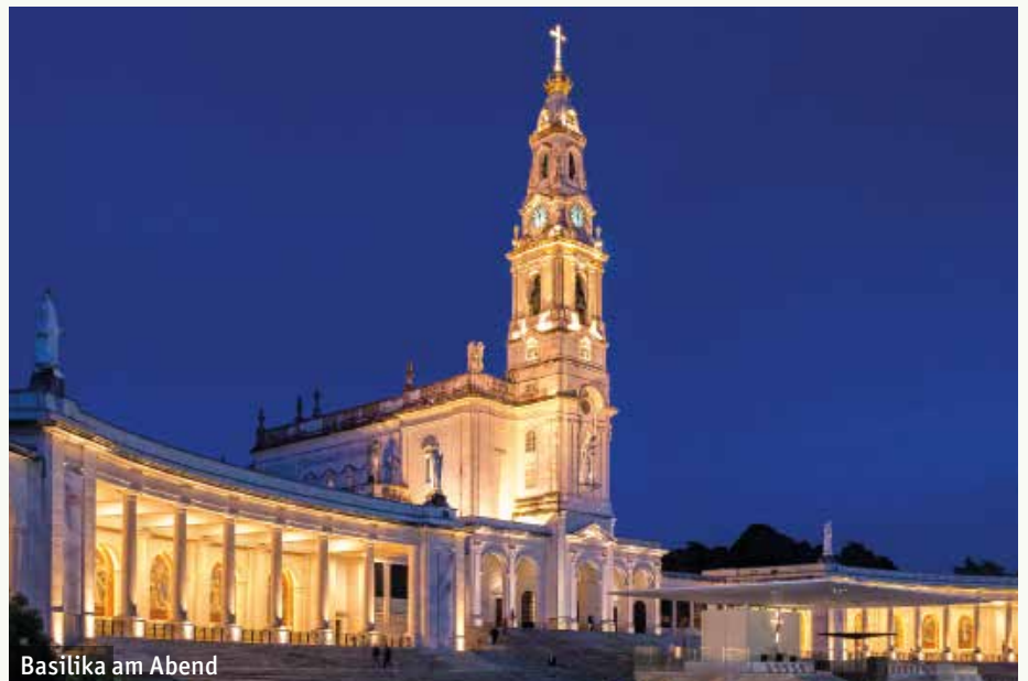
Basilika am Abend