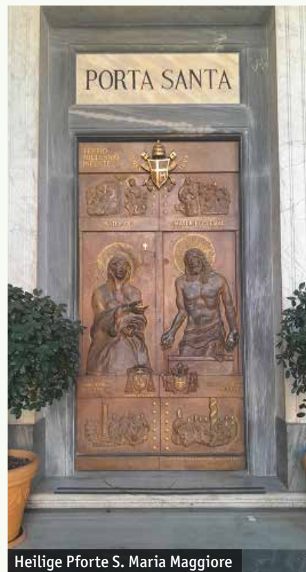
Heilige Pforte S. Maria Maggiore

Den heutigen Tag widmen wir dem Besuch des Vatikans. Wir kommen zuerst auf den Petersplatz, eingerahmt von den mächtigen Kolonnaden. Im Zentrum des Platzes ragt der 25 m hohe Obelisk auf, flankiert von zwei prächtigen Brunnen. Die Basilika St. Peter wurde errichtet über dem Grab des Apostels Petrus. Sie ist ausgeschmückt mit unzähligen Kunstwerken, darunter die berühmte Pietà des Michelangelo und der Bronzobaldachin von Bernini. Außerdem sehen wir die Gräber von Papst Johannes XXIII. und Papst Johannes Paul II. Im Anschluss an den Rundgang besteht die Möglichkeit, auf das Dach und die